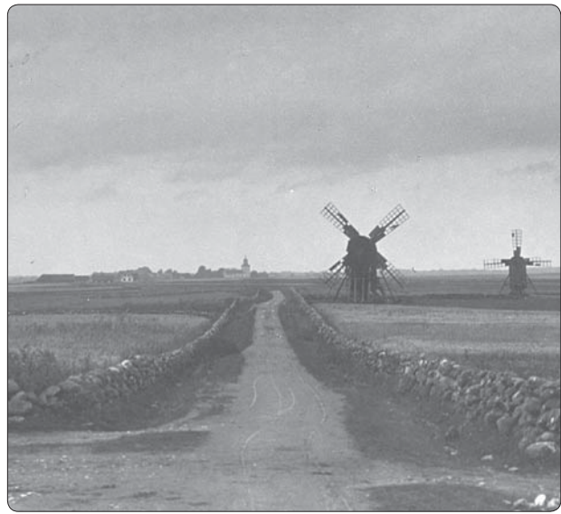
Landskapet har många avläsbara element och historiska dimensioner. Bilden kommer från Öland.

Försök att avläsa och tolka landskapet runt den valda kulturmiljön. Landskapet är den bästa källan till kunskap om gångna tider. Frys bilden till den tid då kulturmiljön var i bruk. Kan du se hur landskapet såg ut då? Människorna?