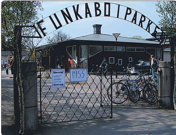
50-talsfest på Västra Funkaboskolan i Kalmar. Ett samarbete mellan skolan, länsmuseum och det lokala föreningslivet.

Ni lärare som vill studera kulturmiljön i undervisningen: Tag kontakt med närmaste länsmuseum eller stadsmuseum, för samarbete.