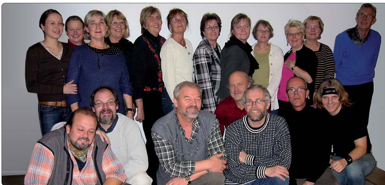
Den pedagogiska enheten Alla Tiders Historia på Kalmar läns museum.

I Lpo 94 betonas det historiska perspektivet som ett av fyra perspektiv som är angeläget i all undervisning: ”Genom ett historiskt perspektiv kan eleverna utveckla en beredskap inför framtiden och utveckla sin förmåga till dynamiskt tänkande.” (Lpo 94, skolans uppdrag)