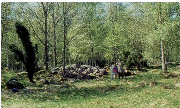
Odlingslandskapet är en kulturmiljö som ligger nära till hands för många skolor.

Lärare och museipersonal väljer tillsammans ut en kulturmiljö, lämplig att använda i undervisningen. Kulturmiljön ska ligga i närheten av skolan. Den ska vara tydlig, gärna lite avgränsad och det ska finnas källmaterial. Naturligtvis ska den vara från en tidsepok som överensstämmer med skolans kursplaner.