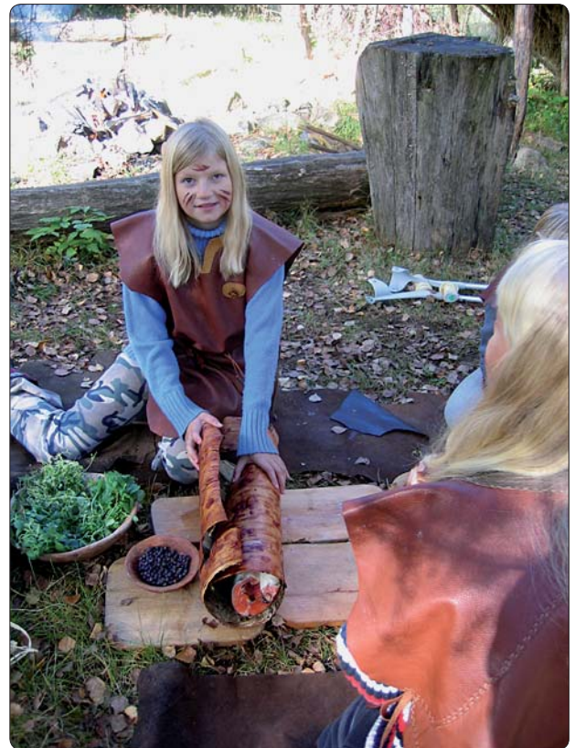
Fisken görs i ordning för att läggas ned i gropugnen.

”Jag trodde det skulle bli tråkigt, men...”