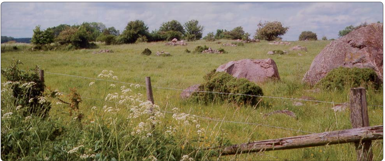
Odlingslandskapet berättar om markernas utnyttjande under olika tidsperioder. Där kan finnas spår av människor, från stenåldern fram till idag.