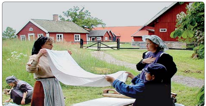
Välkommen till Kyrkeby bränneri i Vissefjärda! År 1904.

(Några elevers spontana kommentarer efter en tidsresa)