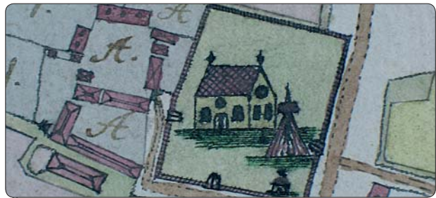
Aldre kartmaterial kan ge en bild av kyrkan och bygden.

Museipersonal går igenom det källmaterial som hör till kulturmiljön, gärna i ett regionalt och nationellt perspektiv. Det kan röra sig om skriftligt material, kartor, fynd, litteratur med mera.