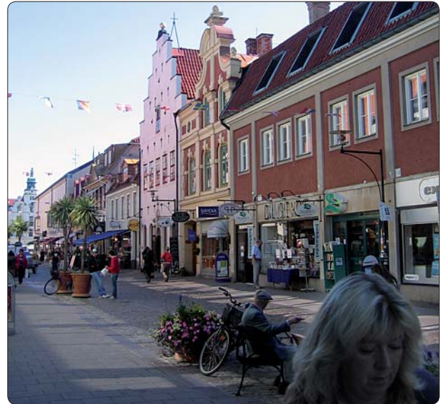
Staden är en del av de flesta människors kulturmiljö.