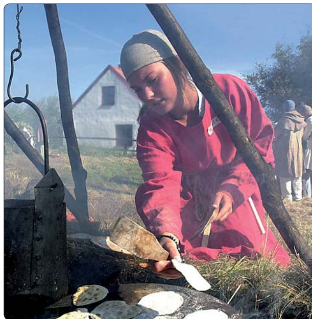
Rollspel med en gymnasieklass vid borgen i Skanör. Året är 1432.