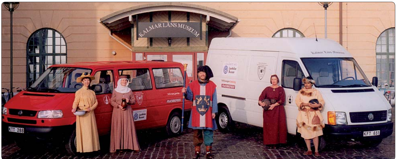
Utanför Kalmar läns museum. Bussar fulla med historiska dräkter och rekvisita, ställs till skolornas förfogande, i samband med de historiska tidsresorna.