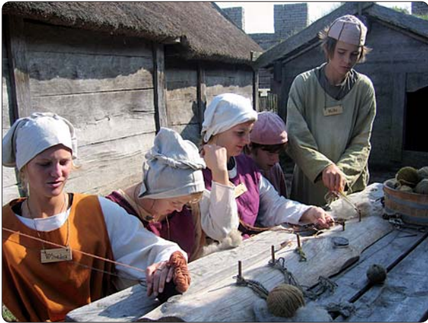
16-åringar tillverkar band till soldaternas kläder i det tidigmedeltida Eketorps borg

Studier i kulturmiljön är lika viktig för elever i alla åldrar: förskola, grundskola, gymnasium och vuxenundervisning. Man kan vara 5, 17, 28 eller 60 år, alla har samma behov av en kvalitativ läroprocess, med konkretion och sammanhang.