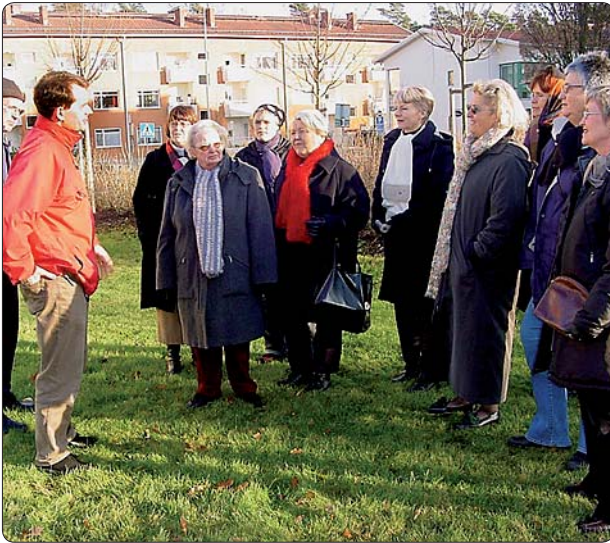
Ett hyreshusområde från 1950-talet introduceras för lärarkollegiet.

Kulturmiljön är en stor resurs i undervisningen, ofta alltför lite utnyttjad. Vi är helt omgivna av kulturmiljöer från olika tider, som förbinder dagens samhälle med gårdagens. Miljöerna nära skolan hjälper till att skapa mening i elevernas tillvaro.