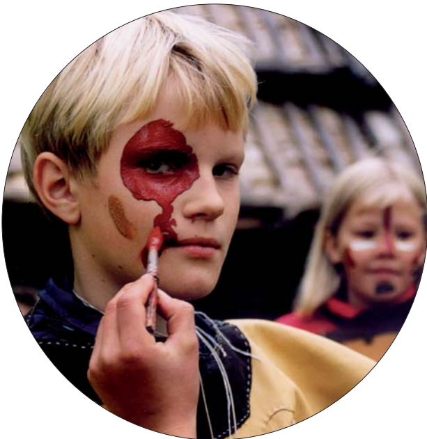
En tioåring blir en stenåldersmänniska och målas i stammens färger.