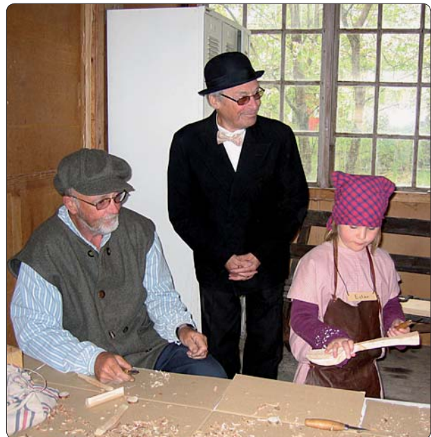
Vuxna och barn tillsammans på snickeriet i Ruda, år 1913.