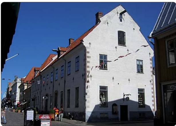
Staden har många intressanta kulturmiljöer. Kaggensgatan i centrala Kalmar.