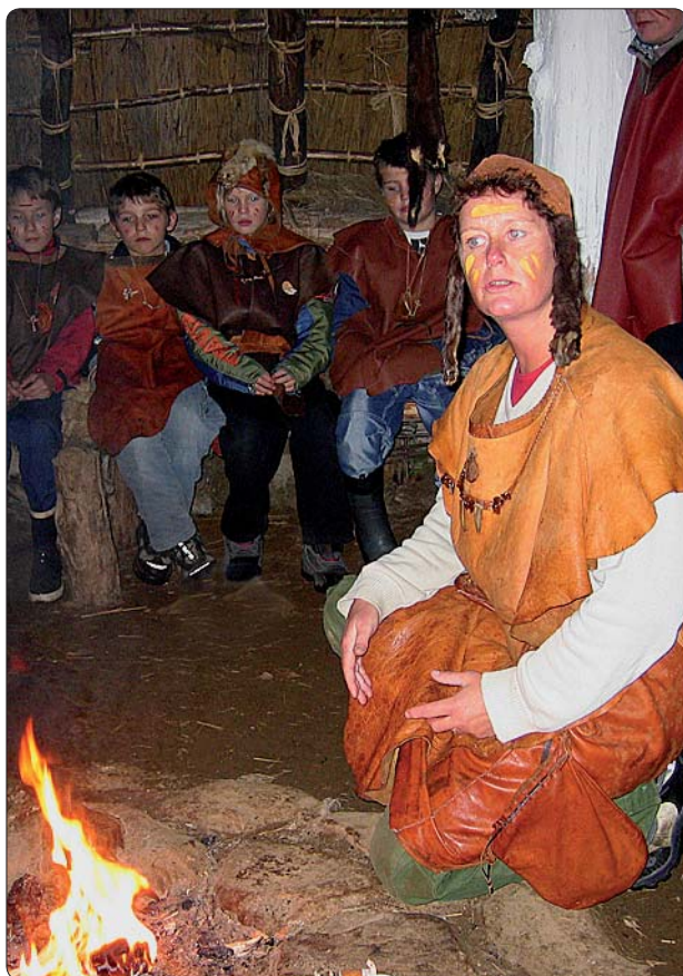
Stenåldersdag i Västraby, Lindås, en resa 5000 år tillbaka i tiden. Berättelsen vid elden fångar tidsandan och gör att eleverna släpper nutiden.

Tidsresan, ute i kulturmiljön, är en viktig del för att befästa kunskapen. Då är elever och lärare de personer som man studerat i skolan. Tiden fryses till ett bestämt årtal och man deltar i några av de händelser som ägt rum på platsen. Rätt utförd, med historiska kläder, är tidsresan en stark metod, som ger eleverna en djupgående upplevelse och bestående kunskap.