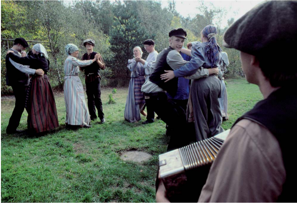
Äntligen lördag. Dans på Södra bruket i Degerhamn år 1905