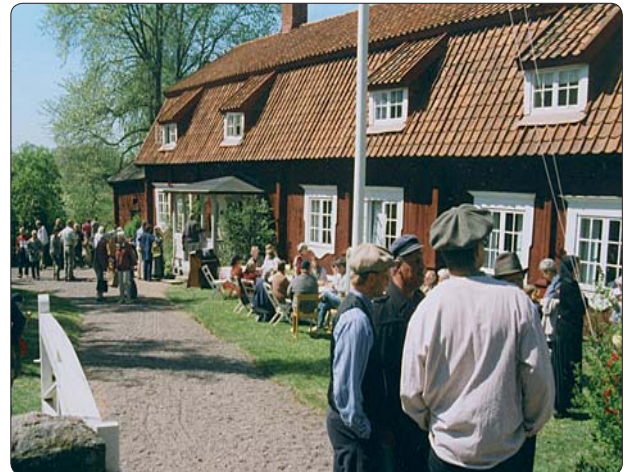
Bötterums gästgivaregård år 1867. Denna historiska festdag, våren 2001, anordnades i samarbete mellan skolan, länsmuseum och den lokala hembygdskommittén.